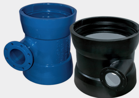
Tablica wymiarów | Table of sizes | Таблица размеров