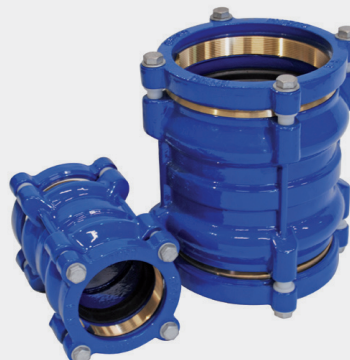
Tablica wymiarów | Table of sizes | Таблица размеров