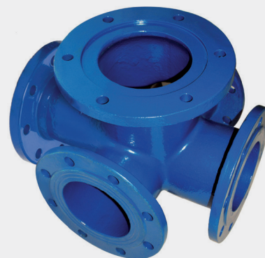
Tablica wymiarów | Table of sizes | Таблица размеров