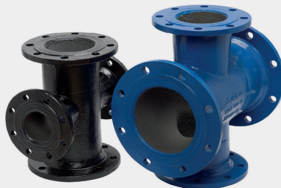
Tablica wymiarów | Table of sizes | Таблица размеров